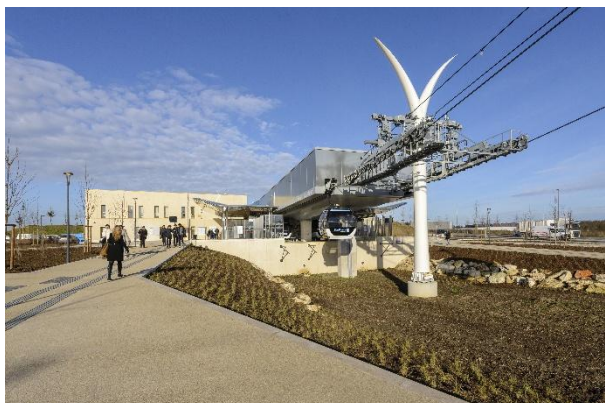
Câbles C1 – Architecte : Atelier Schall