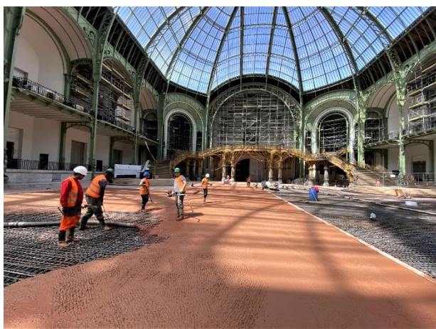
Grand Palais – Architecte : François Chatillon

Elles contribuent à la signature visuelle d'ouvrages emblématiques, illustrant la capacité de Chryso France à accompagner les projets les plus exigeants.